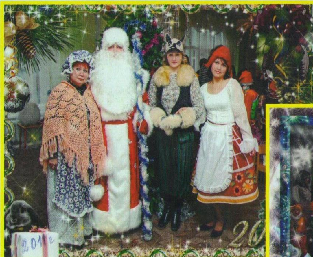
«Бабушка Красной Шапочки»